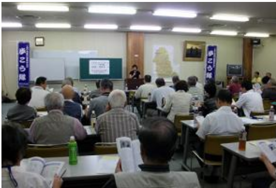
「150年前の有田皿山ば歩こう隊」の発表会

平成 21 年度から開始した「150 年前の有田皿山ば歩こう隊」の活動は 2 年目となる 22 年度もようやく終了した。活動の様子をまとめた冊子が完成し、9 月 28 日生涯学習センターにて完成の発表会を行った。