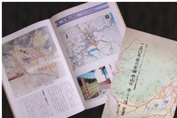
「150年前の有田皿山ば歩こう隊」覚書 其の式